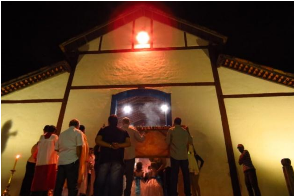
Figura 3: Igreja de Nossa Senhora do Pilar, em 2014, na festa de Nossa Senhora do Pilar. Foto da autora, setembro de 2014.

Para as pessoas do lugar, nem sempre é a longevidade que circunscreve determinadas manifestações como tradicionais ou não, como sugerem a perspectiva institucional, os órgãos de preservação e muitos estudos culturais. Trata-se justamente dessa “comunidade de sentimento”, dessas referências identitárias que dialogam com diferentes saberes (culinária, técnicas de produção, práticas de curas, artes, linguagens, entre outros) enredados nas práticas cotidianas.