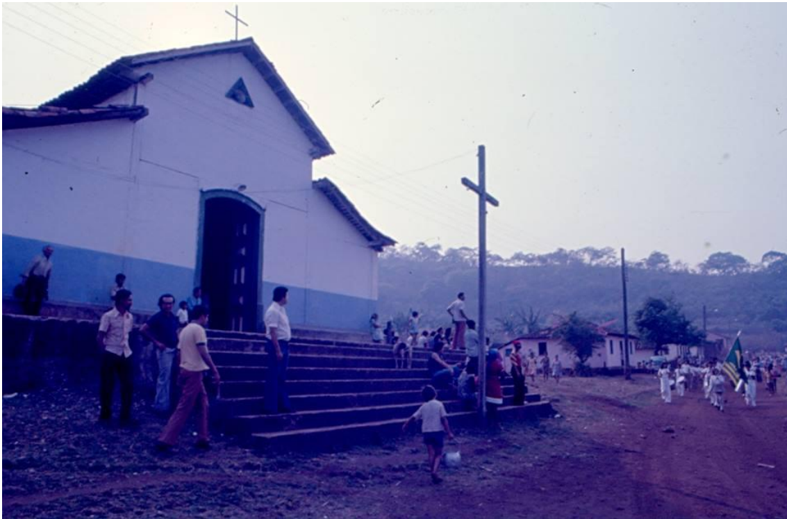
Figura 2: Igreja de Nossa Senhora do Pilar, década de 1970, desfile de escolas, em Pilar de Goiás – GO.

Hoje, as festas são referenciadas como reminiscências vivas do passado que possibilitam determinada continuidade, apesar das descontinuidades sobrevindas. Nas palavras de Eckert (1997, p. 185), “a festa é transferida como um movimento de reatualização do lugar consagrado na imaginação coletiva como palco legítimo da teatralização presente, como contexto propício para reanimar, na memória atual, o lugar do passado”. O lugar em ruínas é lembrado com pesar, ao passo que o lugar que se mantém é reapropriado por meio de práticas simbólicas que nutrem a lembrança e fortalecem os laços identitários, como apresentam as imagens comparativas entre um período e outro, a seguir.