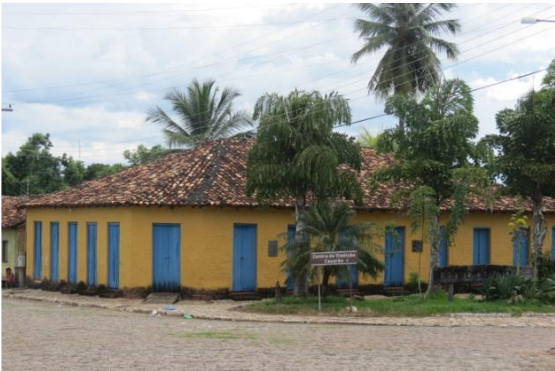
Figura 6: Centro de Tradições, onde atualmente funciona o Museu Municipal Ângelo Rosa de Moura, antigo “casarão”, em Porangatu – GO. Foto da autora, abril de 2014.

Melo (2006, p. 167) ressalta que as folias, como rito de recordação, não são cerimônias que carregam objetos considerados simplesmente como resquícios a serem preservados. O ato de convocar o passado ritualisticamente não significa necessariamente passadismo ou nostalgia. “A memória, em seu poder de revificar narrativas, é criativa. Assim, recordação-comemoração não opera dentro de uma suposta separação entre passado, presente e futuro. A retrospectiva é um ato de protensão, extensão para adiante”.