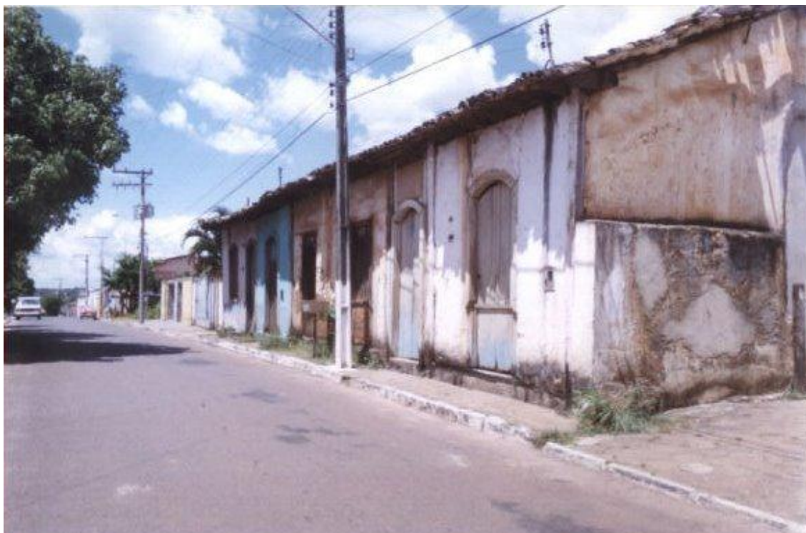
Figura 4: Casarios remanescentes antes do restauro, em Crixás – GO.