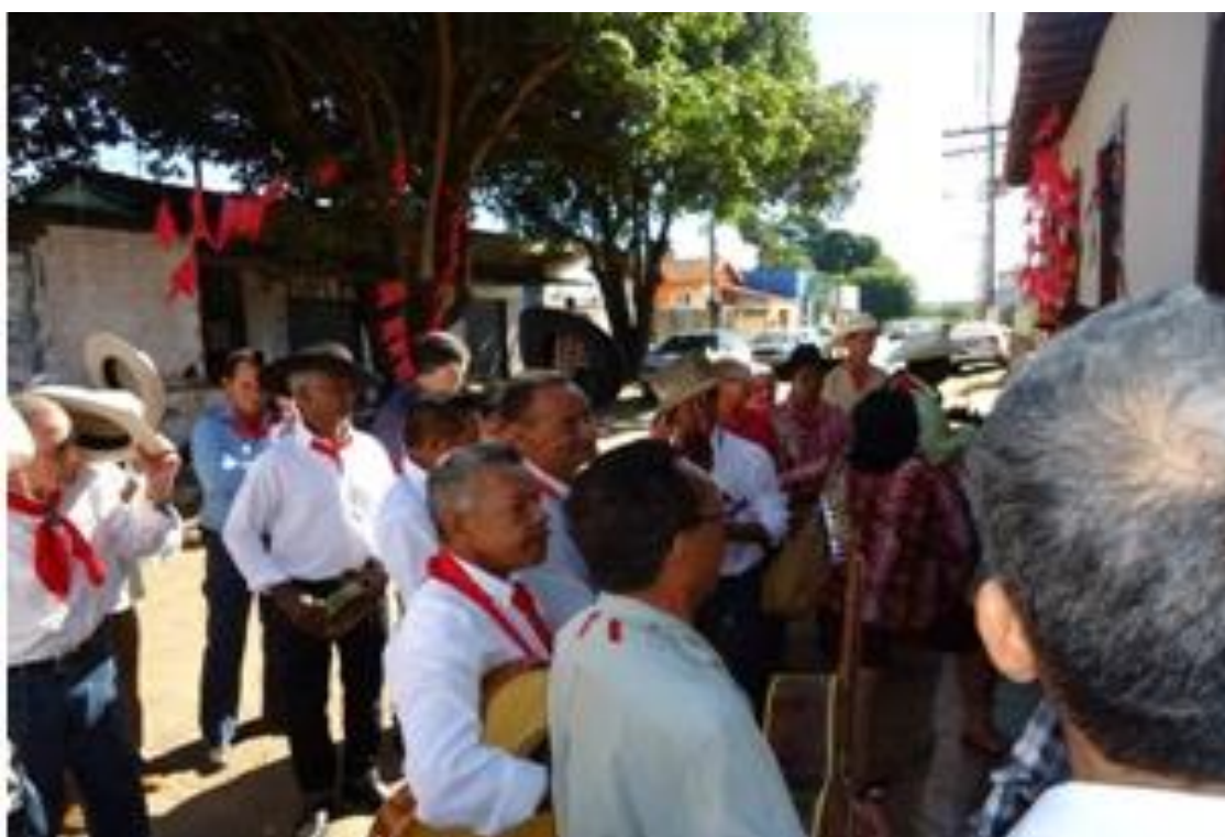
Figura 5: Canto da Folia do Divino em frente ao Casarão já restaurado (atual Espaço Cultural Ursulino Leão).