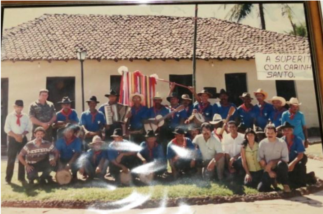
Figura 7: Folia do Divino em frente ao Centro de Tradições. década de 1990.

Ainda que o patrimônio não permaneça na materialidade, ou não se inclua nos projetos de patrimonialização nacionais, considero que ele se mantém no vivido, nos valores simbólicos, nas lembranças e na vivência, podendo mesmo ser locais, pequenas e até familiares , para o caso das cidades em análise.