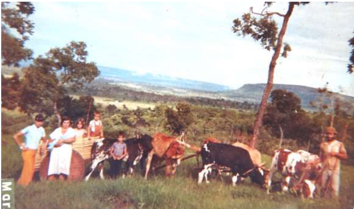
Figura 1: Carro de boi dos anos de 1980 utilizado para o transporte da família e de cargas

Desse modo, a denominação do topônimo Salgado, remonta à época em que era comum a utilização dos carros de bois, que constituíam basicamente em um dos meios de transporte mais utilizado da época, principalmente para o transporte de alimentos e ferramentas de trabalho, mas também da família (Figura 1). Assim, os carros de bois ultrapassavam os arredores da comunidade para buscar mercadorias em Rio Verde, Quirinópolis e no estado de Minas Gerais, e precisavam realizar travessias pelos córregos. Naquela época não dispunham de pontes, sendo necessário atravessar no leito dos córregos, muitas vezes em condições ruins, dificultando a passagem, provocando atoleiros e pequenos acidentes.