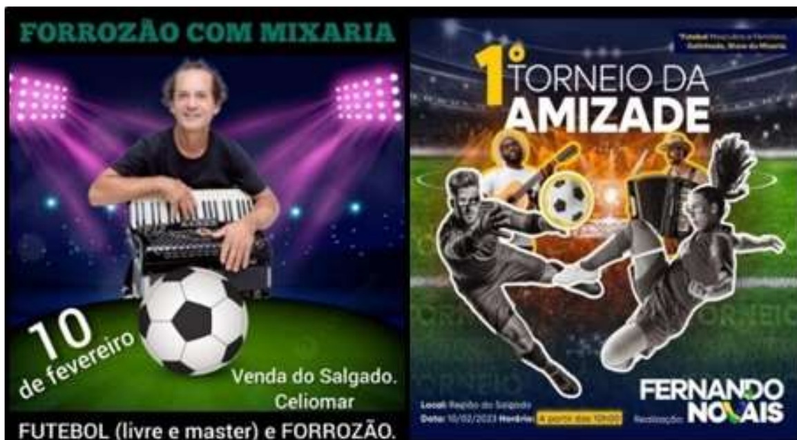
Figura 6: Convite do forró e do jogo de futebol realizado na venda do Salgado.

mobilizadores dos encontros no tempo e espaços extracotidiano, como mostra a figura 6.