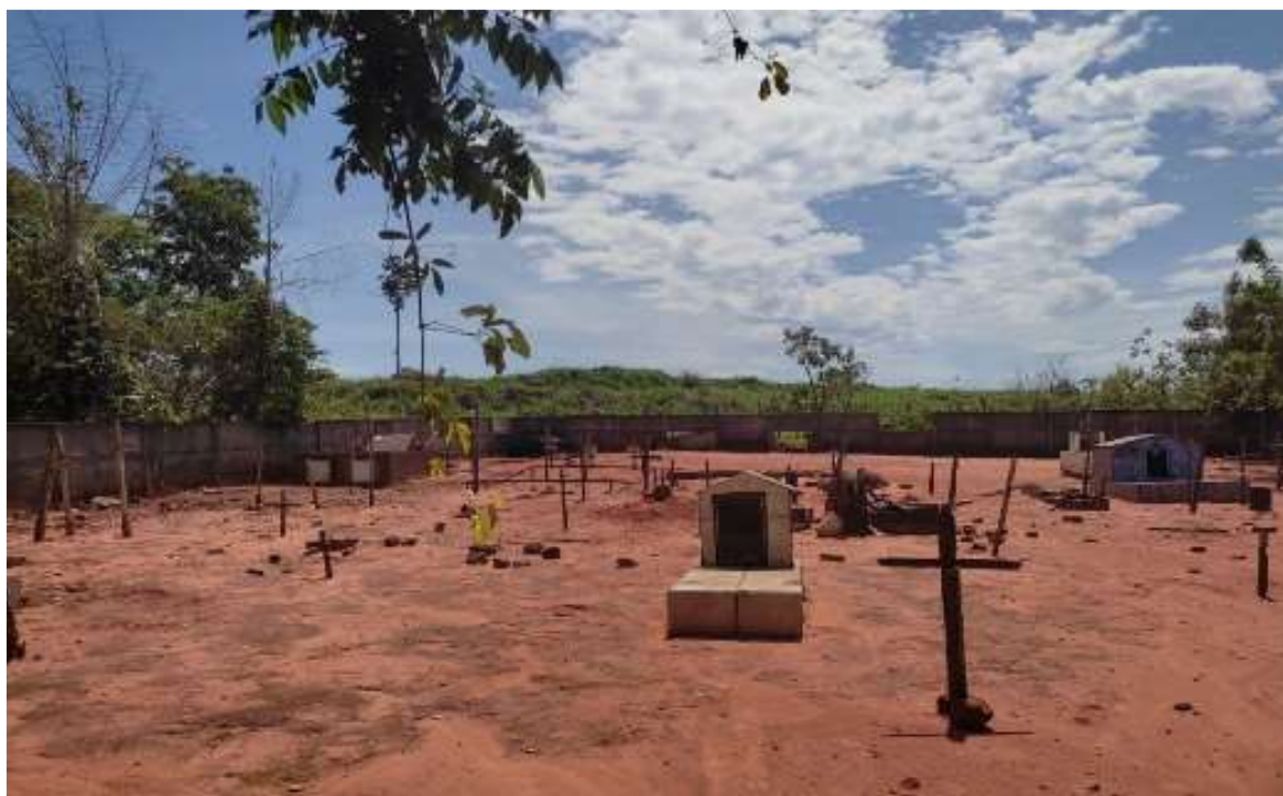
Figura 8: Vista parcial do cemitério rural da Comunidade do Salgado.