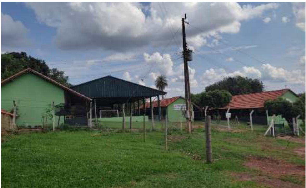
Figura 2: Escola Municipal Custódio Antônio Cabral.