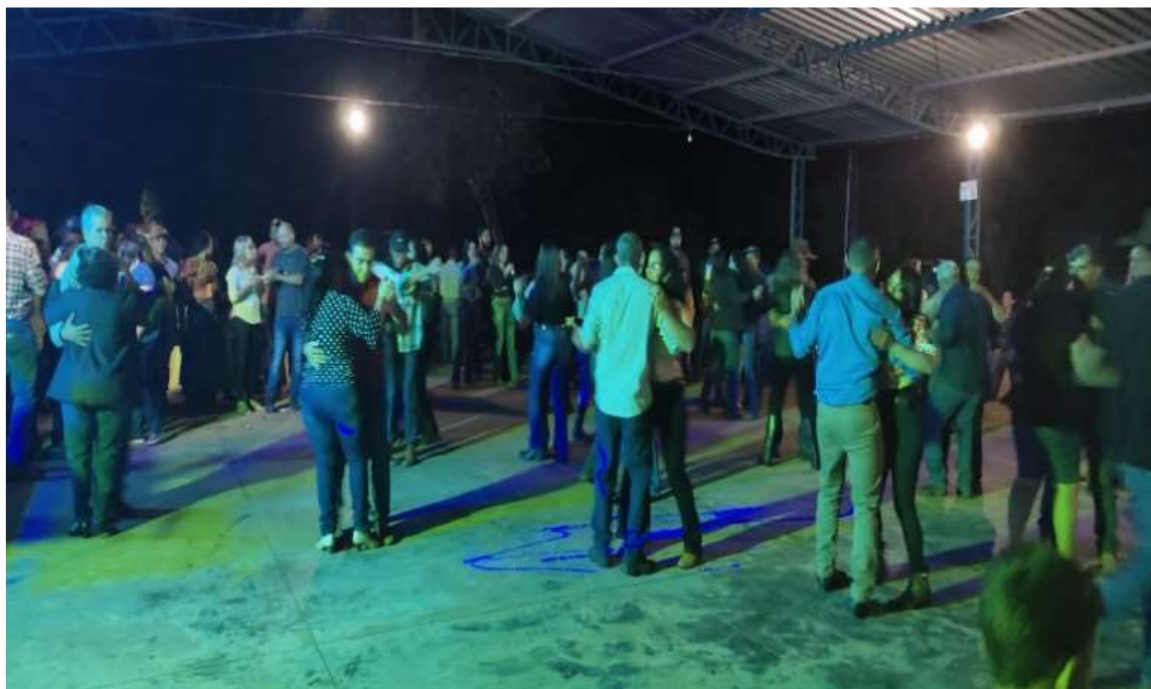
Figura 7: Registro do forró na venda Cinco Irmãos.

crianças em pares seguem o ritmo e o compasso da sanfona. Instrumento que também animou os casamentos e as festas de mutirões de outrora.