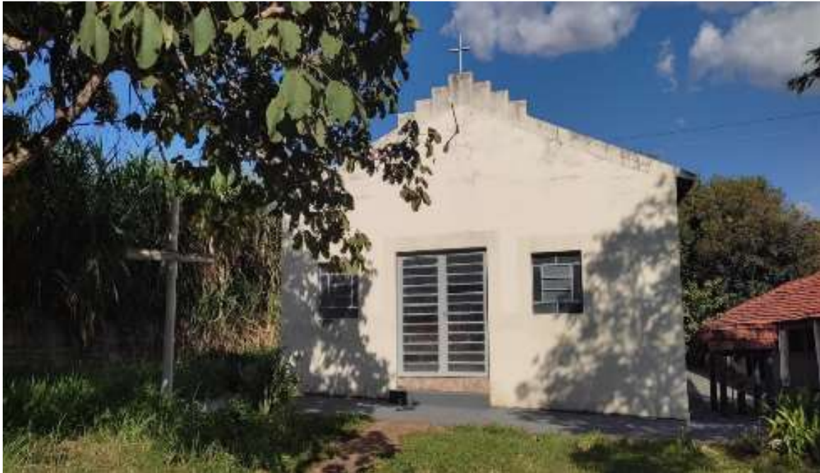
Figura 3: Igreja São Francisco de Assis.