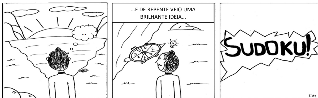
Fig.5– Quadrinho: Yu, e o quadrado mágico!

Há milhares de anos o Imperador Yu (2800 a.C.), da dinastia Hsia, resolveu dar uma volta. Quando estava próximo ao rio Lo, conhecido como rio amarelo, teve vontade de observá-lo e de repente vê uma tartaruga, mas não era uma tartaruga qualquer, ela era sagrada. Na sua carapaça apresentava em cada escama córnea formações. Yu combinou as diferentes formações e identificou uma regularidade. Somou em linhas, somou em colunas, somou em diagonal e obteve todo o resultado 15. Descobrendo assim o quadrado mágico (Fig.5).