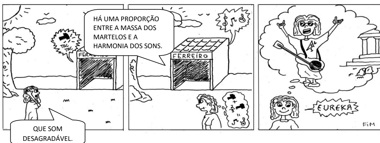
Fig.3 – Quadrinho: Pit, o pai da música

Há muito tempo, um grande filósofo e matemático que viveu no século VI a.C. chamado Pitágoras de Samos resolveu passear. Ao passar em frente a uma oficina de ferreiro, escuta o som de martelos golpeando o ferro, de repente isso o chamou atenção. Pitágoras notou que alguns martelos, usados ao mesmo tempo, produziam um som muito agradável, mas quando um só ferreiro batia um determinado martelo, o corpo fazia um som desagradável. Por essa razão, Pitágoras começou a observar os martelos, percebeu que a massa dos que geravam o som agradável eram proporções da massa dos demais. Ele viu que os martelos com a metade ou dois terços do outro, produziam sons harmônicos quando usados juntos. O martelo que ficava fora da harmonia, não tinha razão numérica com a massa dos outros. Com isso, Pitágoras concluiu que as notas musicais possuem proporção numérica (Fig.3).