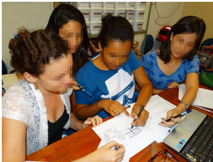
Fig. 2 – Momentos de construção dos quadrinhos.