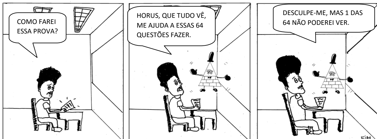
Fig.4 – Quadrinho: o olho, o mistério egípcio

uma fração inteira, faltava \frac{1}{64} do olho construído. Os Egípcios acreditavam que esse pedaço era mágico e não podia ser visto (Fig.4).