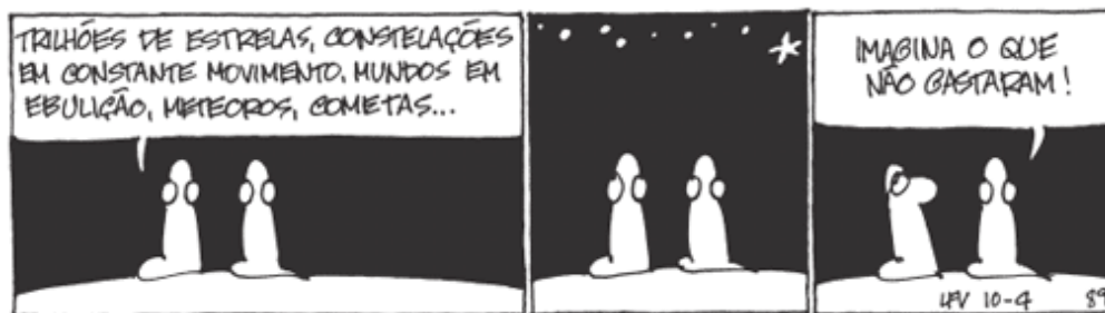
Fig. 1- Exemplo de quadrinho com traçado simples

Nossa experiência com a utilização do Quadrinho no ensino de Matemática voltado principalmente para a formação inicial de professores nos mostrou, que o fato de não saber desenhá-lo, não representa um obstáculo a aprendizagem dos conceitos matemáticos. Dependendo do que será proposto, um “bonequinho com a cabeça grande e com o corpo e pernas feitos de pauzinhos” já é o suficiente para empregar esse recurso. Na fig.1 apresentamos uma tira de traçado simples de Veríssimo (2010):