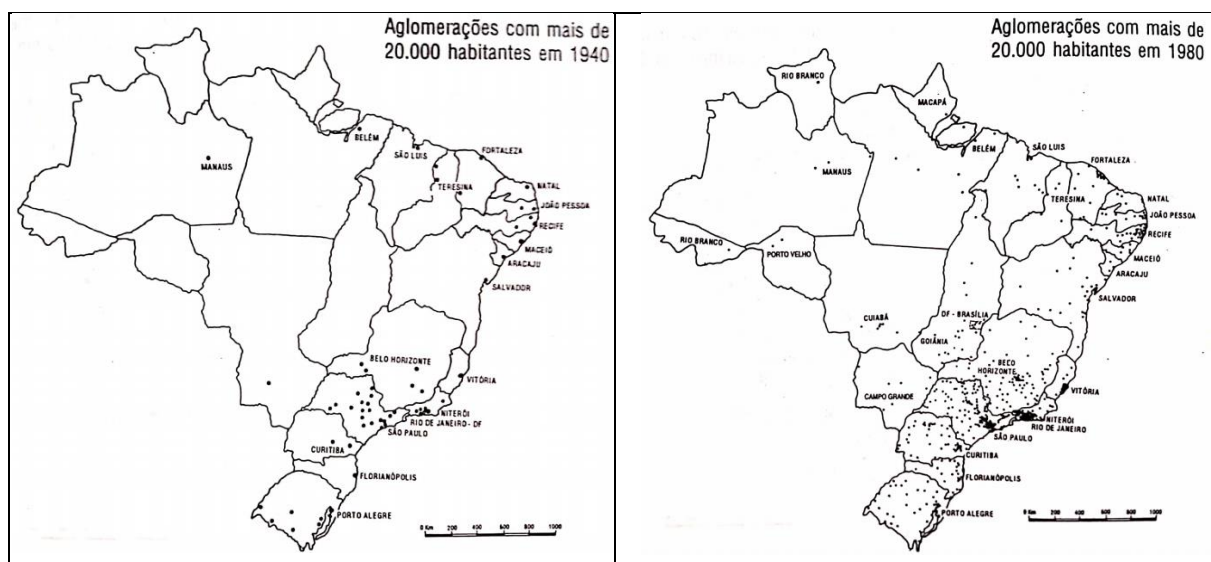
Figura 1. Brasil: aglomerações com mais de 20.000 habitantes, 1940.

Na década de 1940, os dados populacionais mapeados por Santos (1996) evidenciam apenas Belém, Manaus, São Luís e Cuiabá com população superior a 20.000 habitantes na Amazônia Legal (Figura 1). Na década de 1980, nota-se número mais expressivo de aglomerações com mais de 20.000 habitantes nessa região (Figura 2), mas poucas com porte populacional na faixa entre 100.001 e 500.000 habitantes (Figura 3), como mapeado por Bessa (2001). Mesmo na década de 1990, observa-se número discreto de cidades na faixa populacional entre 100.001 e 500.000 habitantes na Amazônia Legal (Figura 4).