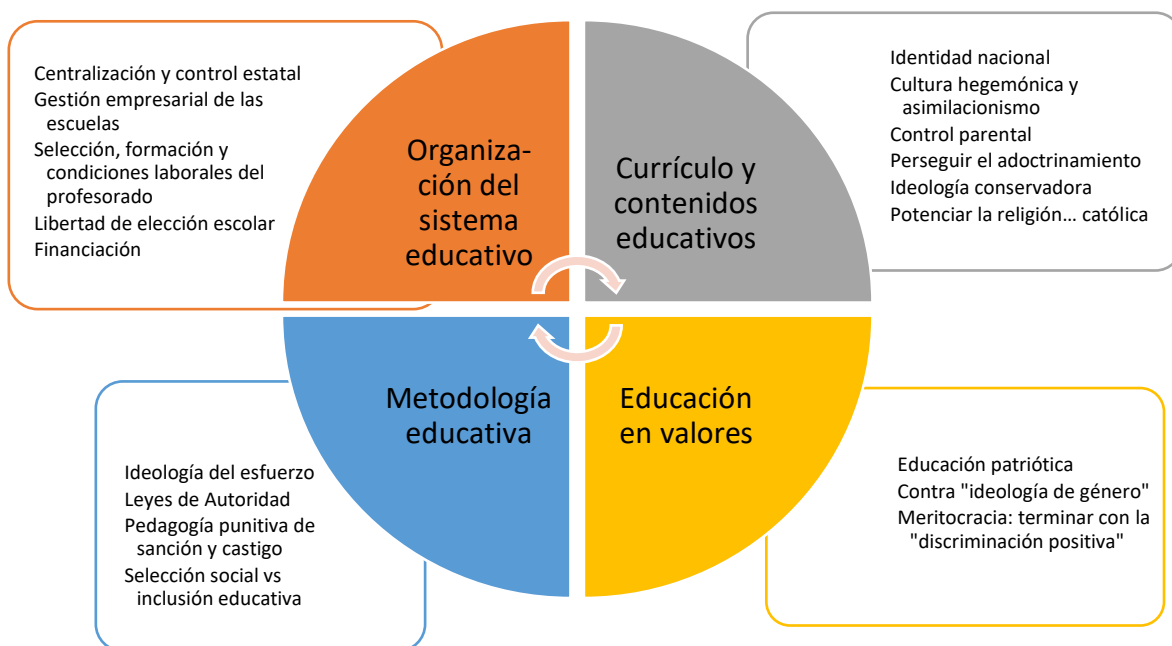
Ilustración 2. Categorías y subcategorías detectadas en el ACD