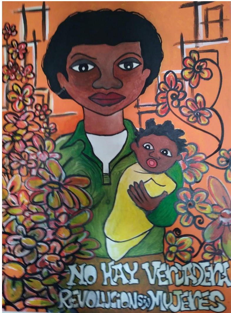
Pintura Odaymar: No hay verdadera revolucion sin mujeres.