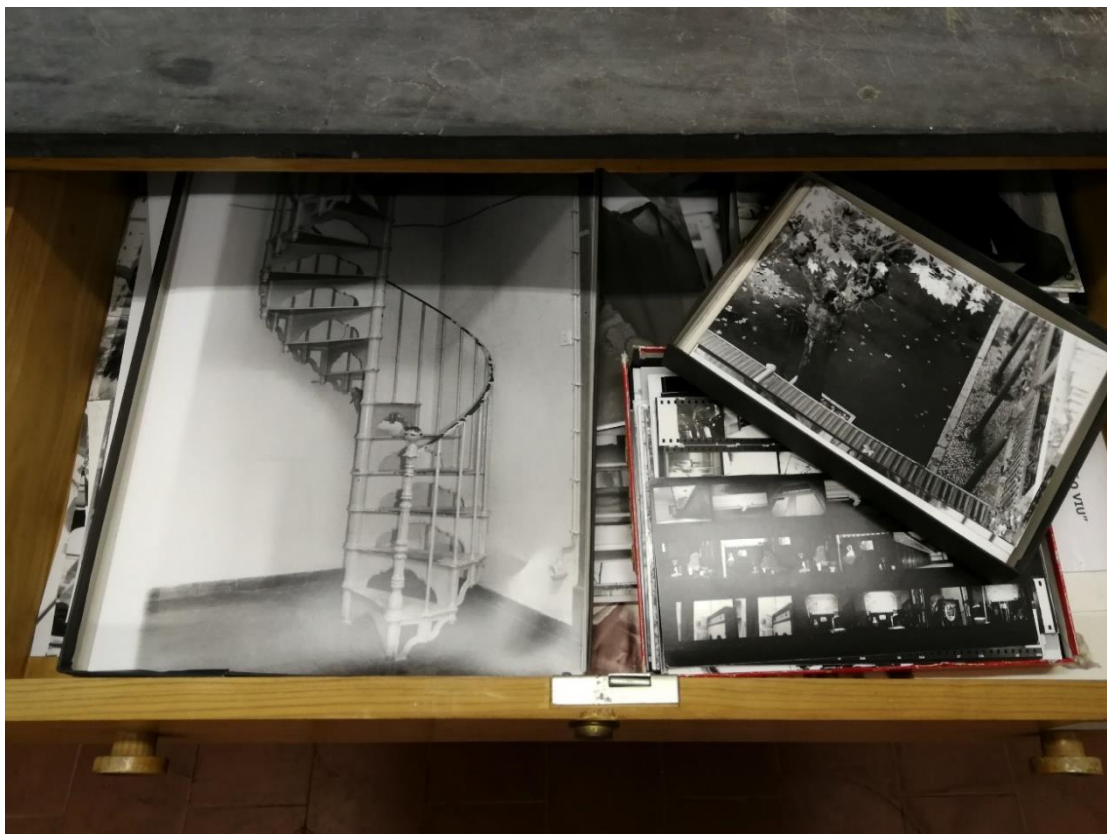
Figura 11: Gaveta com ampliações feitas por elementos do antigo Clube de Fotografia E.S. Camões (fotografia atual).