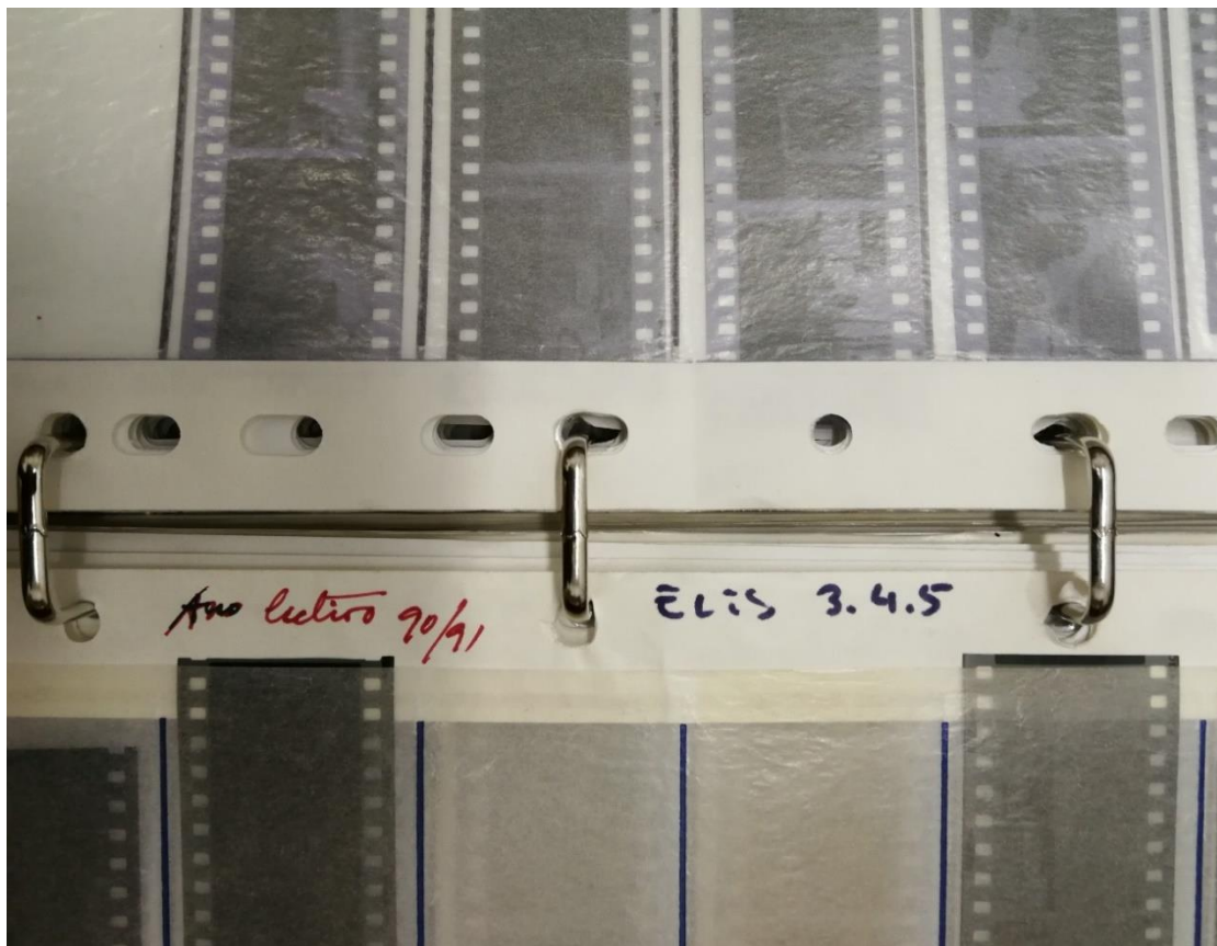
Figura 10: Dossiê contendo negativos do antigo Clube de Fotografia E.S. Camões (fotografia atual).