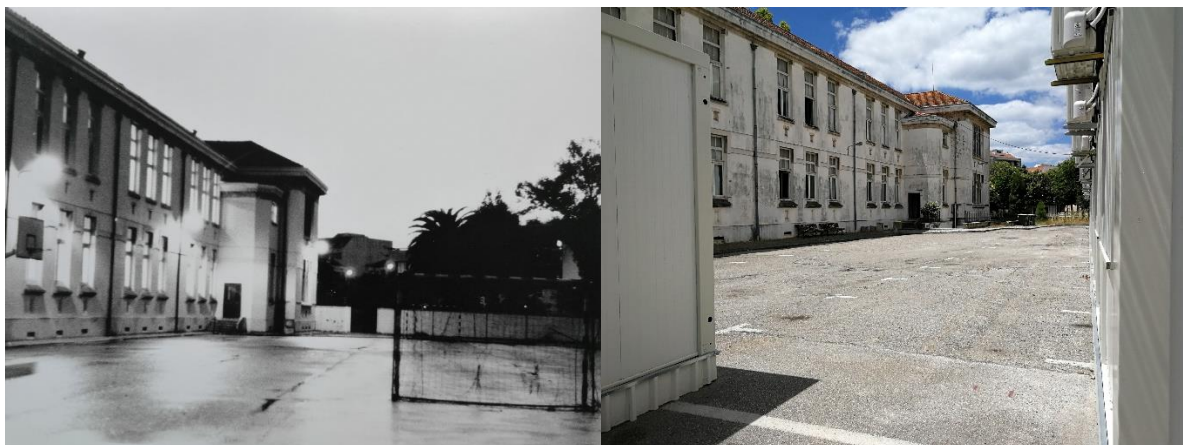
Figura 13 e 14: O mesmo espaço enquanto campo de jogos (assinado no verso: Susana Fonseca – s/data – arquivo da gaveta ) e com monoblocos (fotografia atual – 2020).