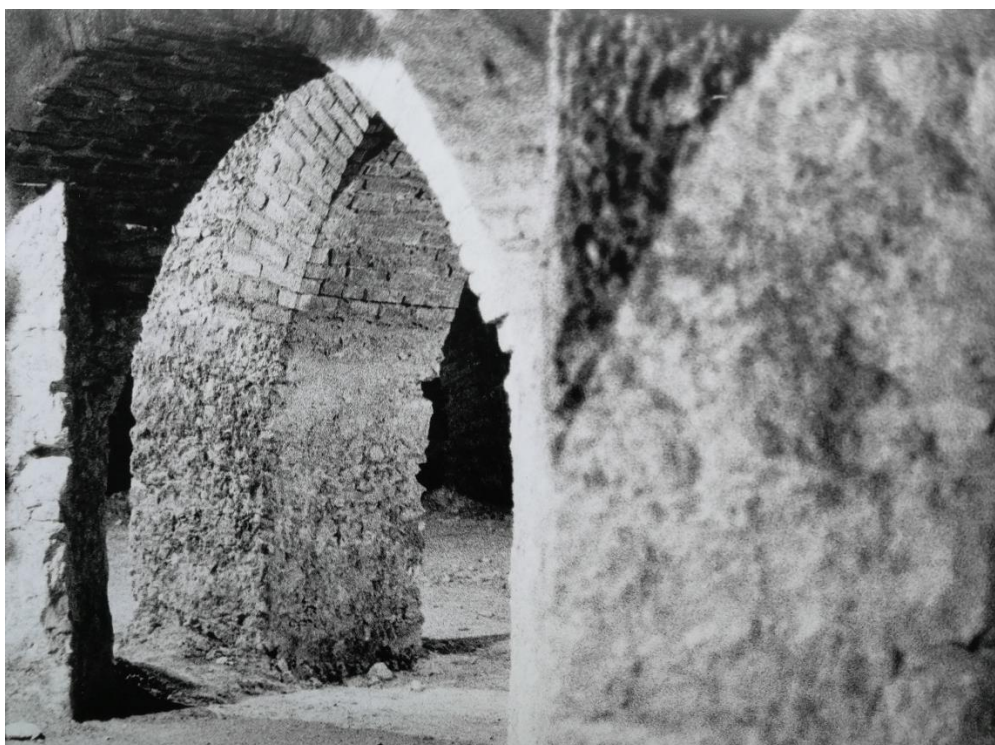
Figura 12: As Caves da E.S. Camões (assinado no verso Alexandra – s/data – arquivo da gaveta ).