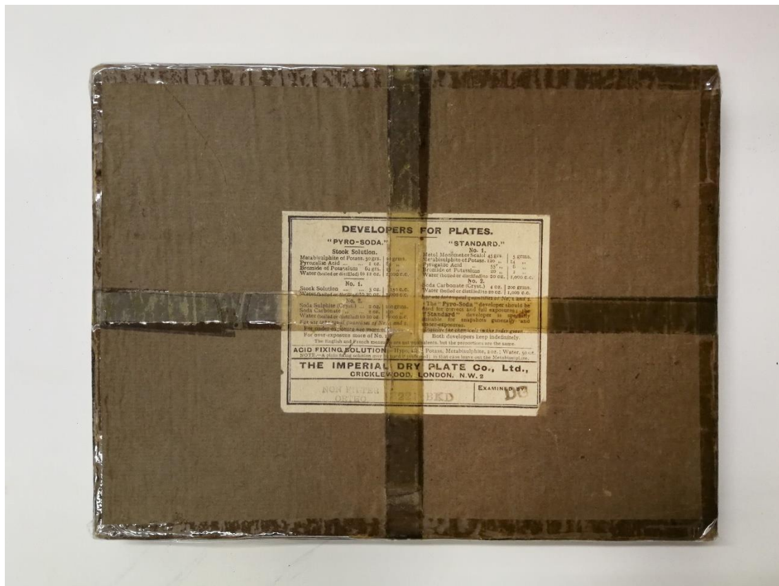
Figura 1: Caixa de papelão contendo sete negativos de vidro 18x24 cm.

fundo de uma das gavetas que encontrei uma caixa de cartão fechada com fita cola muito envelhecida contendo sete negativos em vidro 18x24 cm, sem data, mas evidentemente bastante antigos. As imagens eram da escola. Mas onde se integram aquelas chapas de vidro? O que mostram realmente e que significado têm?