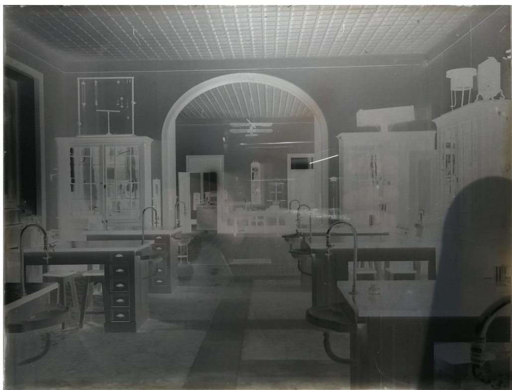
Figura 2: Um dos negativos de vidro encontrados no Laboratório de Fotografia

Regresso agora ao início do artigo, e às chapas que encontrei na gaveta. São sete negativos em vidro, 18x24 cm. Todas as fotografias são de interiores, quatro de Laboratórios (possivelmente de Física, Química e Biologia) duas salas (Geografia e Física) e uma de uma planta da escola (que não corresponde na íntegra a qualquer edificação efetivamente concluída) presa a uma parede com parafusos. As fotografias devem ser da segunda metade da década de 1920, talvez durante a construção dos Gabinetes de Física e de Química em 1927. 4 Enquanto documento histórico, a fotografia (tirando os retratos de identificação dos alunos) não pertence aos arquivos oficiais: não é ata, não é processo, não é exame, não é livro de ponto. Daí talvez estes negativos em vidro aparentem estar esquecidos literalmente no fundo de uma gaveta.