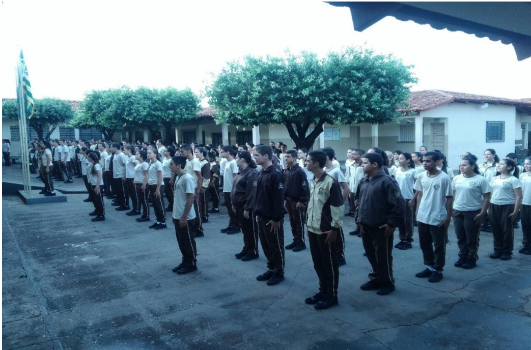
Foto 5 - Os alunos reunidos no pátio do CPMG Unidade Dr. Pedro Ludovico, para pronunciamento quanto aos regulamentos disciplinares internos.

Podemos ter noção dessa postura cobrada através da foto 5, que demonstra um dos momentos de reunião entre todos os alunos no pátio do colégio para pronunciamento dos responsáveis pela administração.