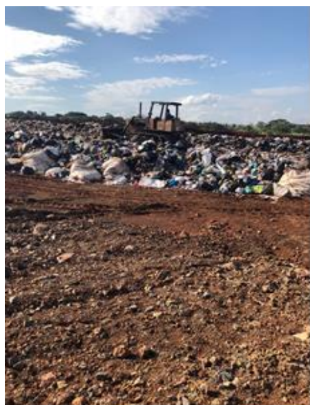
Figura 8: Trator utilizado para acomodar e cobrir o lixo na vala.

impermeabilização, drenagem e compactação ocorrem de maneira adequada, evitando o acúmulo de lixiviados e conseqüentemente a movimentação de massa em períodos chuvosos.