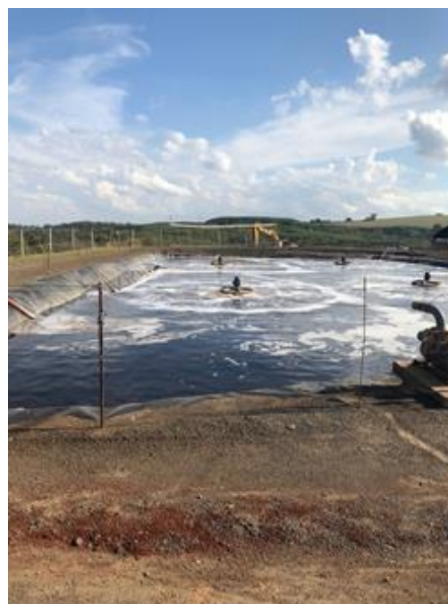
Figura 13: Lagoa para tratamento dos lixiviados gerados no aterro. Fonte: GALDINO, S. J, 2019.