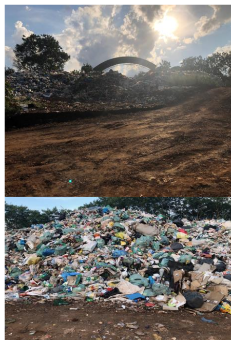
Figura 15: Materiais previamente separados nas residências.

Trata-se de uma área do antigo aterro, com barracão cedido pela prefeitura do município, localizado em parte do lote de terras 31-B-A, com aproximadamente 32 cooperados (figuras 16 e 17). Com base nas informações repassadas, a CooperVidro possui