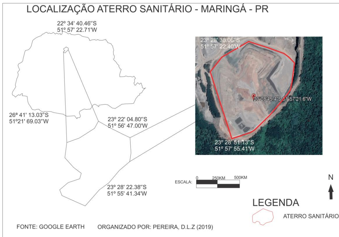
Figura 5: Localização do Aterro Sanitário de Maringá - PR.

Ainda, com base em informações do PMGIRSU (2017), no final de 2009 foi aberta uma licitação para concessão do tratamento do lixo em uma célula sanitária localizada na Pedreira Ingá (figura 5), próxima ao local onde foram depositados os resíduos do município durante várias décadas. Atualmente a destinação final é realizada em área de antiga pedreira, que segundo levantamento é considerada área ideal para a demanda de aterro. A primeira vala implantada ocorreu em 2010, com infraestrutura considerada adequada.