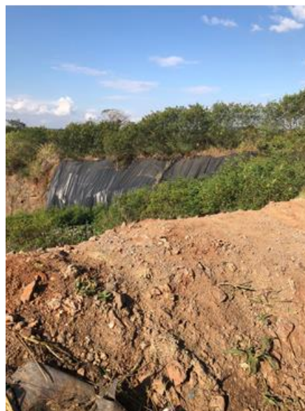
Figura 7: Vala com geomembrana para evitar a infiltração de lixiviados no solo.

Após a deposição dos resíduos na vala, é realizado o processo de compactação dos resíduos, com a utilização de trator esteira (figura 8). De acordo com as informações, a compactação dos resíduos é considerada ótima, entorno de 0,65. O transporte dos resíduos até o aterro é realizado por caminhões compactadores (figura 9). Os procedimentos tais como