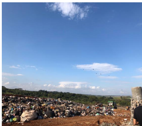
Figura 11: Presença de urubus nas imediações devido ao lixo exposto.