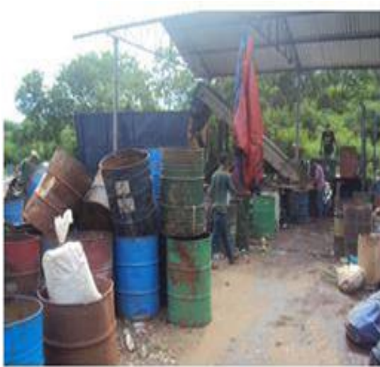
Figura 16: As condições de trabalho dos cooperados na CooperVidros.

As cooperativas apresentam dificuldades em comercializar alguns materiais coletados, os quais acabam sendo encaminhados para o aterro. Também foi identificada a presença de materiais recicláveis juntamente com os rejeitos, ocasionando impactos negativos no sistema de coleta seletiva. Verificou-se ainda uma flutuação no número de trabalhadores na cooperativa, dificultando a organização, planejamento e eficiência nas atividades.