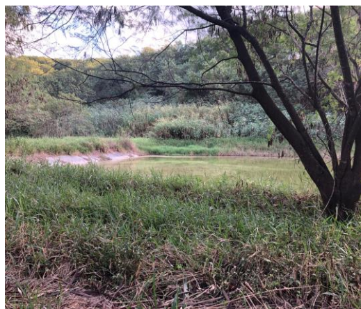
Figura 2: Lagoa de tratamento dos lixiviados do antigo lixão de Maringá.

Nesse local é possível perceber a existência de quatro lagoas que antigamente eram utilizadas para captação e tratamento do lixiviado gerado no antigo lixão (figuras 2 e 3). A infraestrutura implantada nessas lagoas foi considerada inadequada e superficial, contribuindo significativamente na contaminação do solo, ar e água. Mesmo desativado, o local continua gerando passivo ambiental.