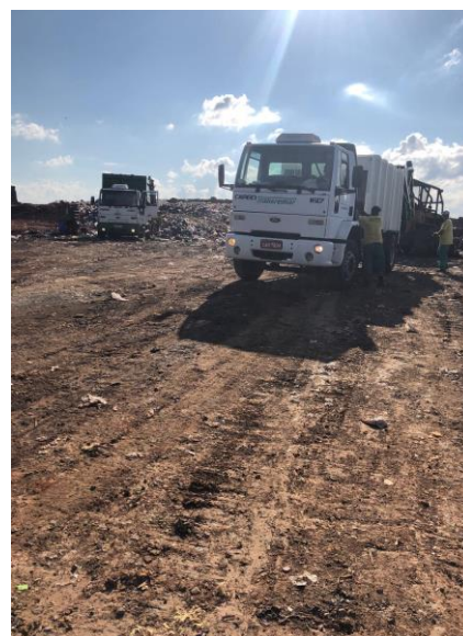
Figura 9: Caminhões utilizados no transporte do lixo até o aterro.

Segundo informações repassadas, o aterro sanitário de Maringá recebe cerca de 420 t/dias de resíduos sólidos urbanos. Lembrando que podem ocorrer variações, pois em épocas de festas ou feriados aumenta o consumo de alimentos, bebidas e embalagens. Somando a esse montante, a demanda de 12 municípios, os quais fazem o transbordo dos resíduos até o aterro. Esses municípios procedem através de licitações.