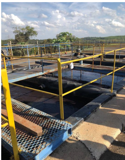
Figura 12: Sistema de recebimento e tratamento dos lixiviados.

De acordo com as normas estabelecidas, após coletado, o lixiviado deve ser tratado antes do descarte em algum curso d'água ou lagoa. A coleta dos lixiviados é realizada pela base do aterro e encaminhada para a estação de tratamento, com lagoas devidamente impermeabilizadas, evitando possíveis contaminações do solo (figuras 12 e 13). No caso de Maringá, parte do lixiviado tratado é utilizada para molhar os acessos ao aterro.