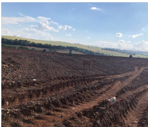
Figura 10: Presença de cachorro das imediações a procura de restos de alimentos.

Durante visita ao aterro sanitário de Maringá contatou-se a presença de urubus e cachorros na área. Todavia, foi informado que a empresa que administra o aterro procede com o monitoramento e controle da presença de aves e animais no aterro (Figuras 10 e 11). É lançados foguetes e rojões para espantá-los, bem como o rápido cobrimento dos resíduos para evitar a exposição prolongada.