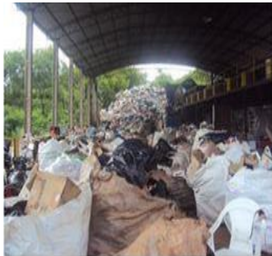
Figura 17: Acondicionamento e armazenamento dos materiais.

De acordo com o Decreto Federal n. 6.135 de 26 de junho de 2007, a prestação de serviços deverá ser executada de forma a garantir os melhores resultados, cabendo as cooperativas aperfeiçoarem a gestão de seus recursos humanos e supervisionar os serviços executados, com vistas à qualidade dos serviços prestados. Dentre outras exigências, garantir o armazenamento, em área coberta, dos materiais recicláveis segregados ou não.