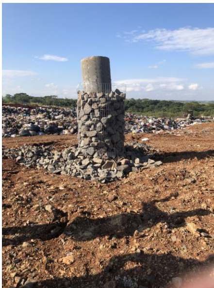
Figura 6: Drenagem vertical dos gases que se acumulam nas camadas de resíduos.

A instalação dos drenos faz-se necessário para controlar a saída de gases gerados no interior das camadas de resíduos. O biogás gerado pode ser utilizado para aproveitamento energético através de um sistema interligado. Já, a impermeabilização da base do aterro evita o contato do lixiviado com as águas subterrâneas. E a coleta de percolados provenientes da infiltração da água da chuva e geração de lixiviados, reduz a pressão sobre a massa de resíduos e diminui as chances de migração desses líquidos no solo.