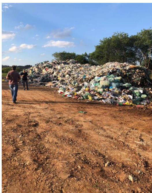
Figura 14: Materiais recicláveis expostos ao relento na CooperVidros.

Durante visita na CooperVidros constatou-se uma grande quantidade de materiais recicláveis depositados ao relento, formando verdadeiras leiras de materiais previamente separados pela população em suas residências (figuras 14 e 15). Isso causou certo sentimento de descontentamento, pois os materiais não estavam devidamente armazenados para posterior triagem e comercialização. Certamente, tal realidade desestimularia a comunidade a continuar separando os resíduos.