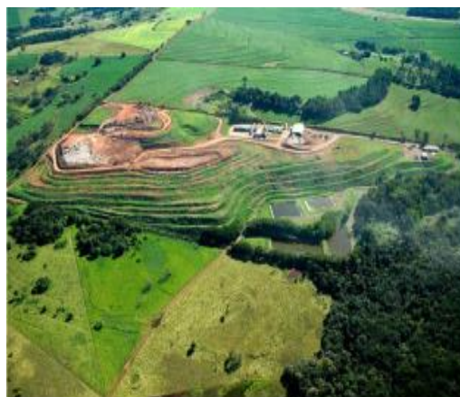
Figura 3: Aterro controlado de Maringá, em 2008, após obras de recuperação da área.