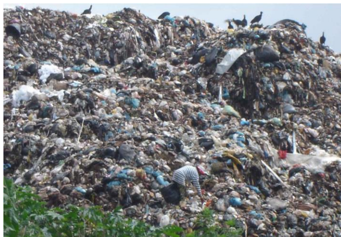
Figura 4: Antigo lixão de Maringá a céu aberto em 2005, com presença de catadores.

De acordo com informações contidas no Plano Municipal de Gestão Integrada de Resíduos Sólidos Urbanos de 2017, no mesmo ano de 1994, o município de Maringá iniciou o programa de coleta seletiva e em 2001 passou a atender os bairros. No entanto, o recebimento dos rejeitos continuou ocorrendo de maneira irregular, justificando as autuações e multas aplicadas pelo IAP- Instituto Ambiental do Paraná (figura 4). O processamento dos resíduos sólidos domiciliares tem sido caracterizado por várias ações de insucessos adotadas pelo poder público local.