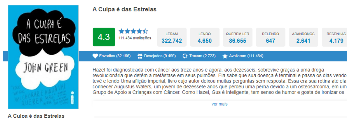
Figura 3 – Exemplo de Página de Livro

cada usuário pode criar em seu perfil dos livros que já leu. Assim como cada membro possui um perfil, para cada livro registrado há também uma página, com diversos dados sobre a obra, que mostra, além de uma breve sinopse, quantas pessoas estão lendo quantas já leram e todas as demais funções. E há o campo da resenha, em que o usuário pode utilizar para ler as já criadas pelos outros membros. Tal fato é muito importante para mostrar que há não somente pessoas que demonstram estar lendo, adicionando livros, etc., mas também produzindo textos neste espaço.