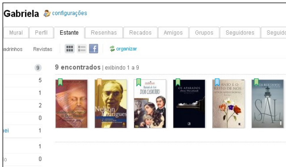
Figura 2 – Exemplo de Estante de Usuário

Atualmente, cresceu ainda mais, com diversas outras ferramentas. É possível trocar livros entre os usuários, há diversos sorteios pelas editoras e possui loja para adquirir o livro também. E outro ponto recente é a interatividade com outras redes sociais, ou seja, pode-se entrar pelo facebook , twitter , etc.