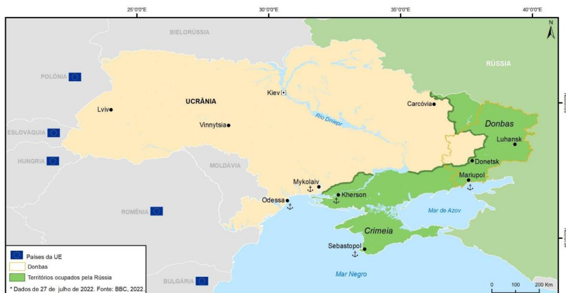
Mapa 1 - Territórios ucranianos ocupados pela Rússia (situação em 27 de julho de 2022) Elaborado pelos autores (2022).

O governo russo, se vendo sem saída, deu início ao que denomina oficialmente de “operação especial na Ucrânia”, iniciada em fevereiro de 2022 e que resultou na ocupação de territórios ucranianos localizados nos oblasts 1 de Zaporíjia, Kherson, Carcóvia, Luhansk e Donetsk (estes dois últimos compõem a região industrial do Donbas). Assim, a Crimeia, controlada desde 2014, passou a estar conectada ao restante do território russo (Mapa 1).