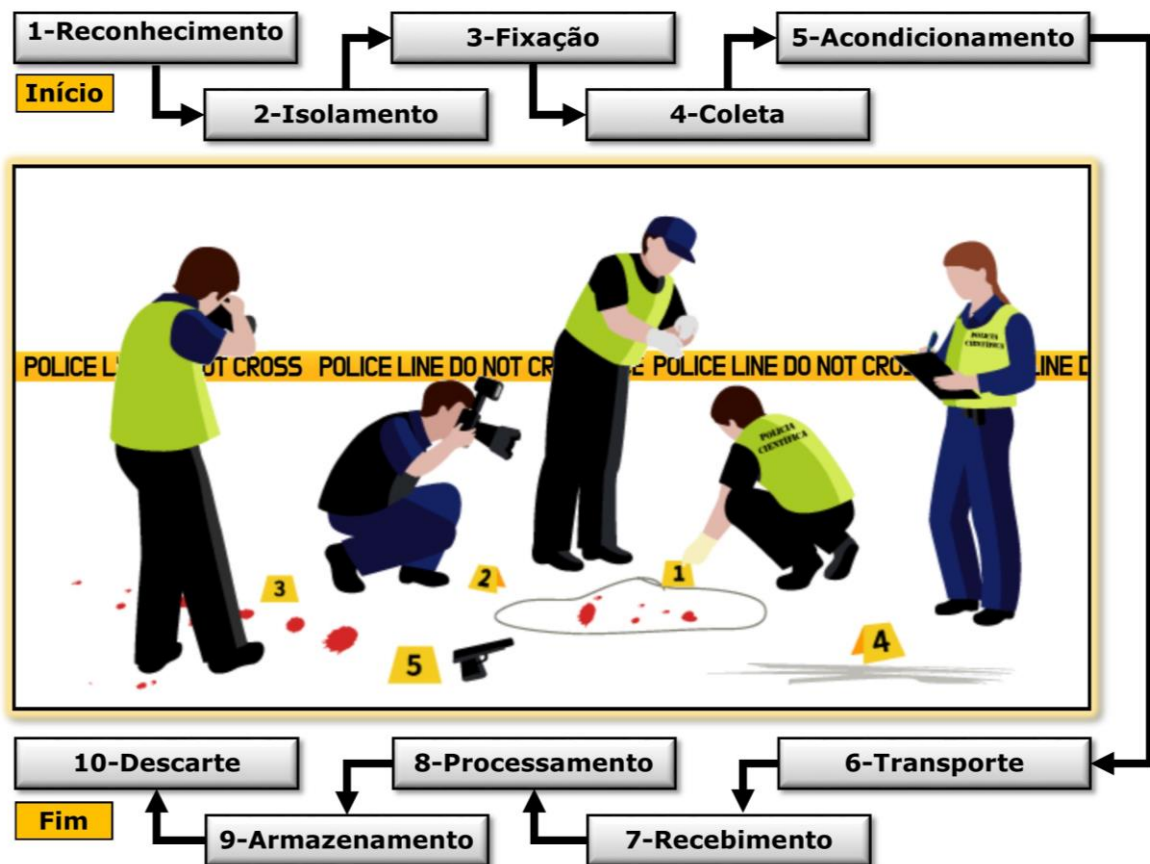
Figura 1 – Representação gráfica das etapas da cadeia de custódia.

A fase interna inclui o processamento (VIII) do vestígio coletado, conforme sua natureza (p.ex. manchas de sangue, projéteis/estojos de armas de fogo, impressões papiloscópicas, etc.), o armazenamento (IX) nas centrais de custódia (Art. 158-E) após finalizada análise pericial e o posterior descarte (X) quando efetivamente necessário. Importante destacar que a rastreabilidade dessas etapas é fundamental para a lisura dos procedimentos probatórios dentro do processo penal, razão pela qual toda etapa cronológica dos vestígios deverá ser documentada, acompanhando esses elementos de prova até o seu descarte final.